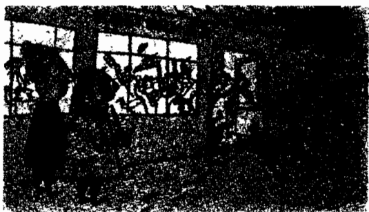
Two peasants in front of the local "House of Culture": "You see, neighbor, when we were young we had to fight in a digny little tavern . . ."