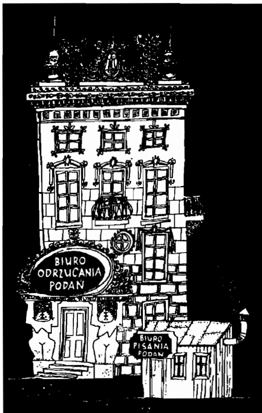
Left: "Application Rejection Office"; right: "Application Writing Office."

Social Security benefits are also denied to collective farmers, although the principle of extending pensions