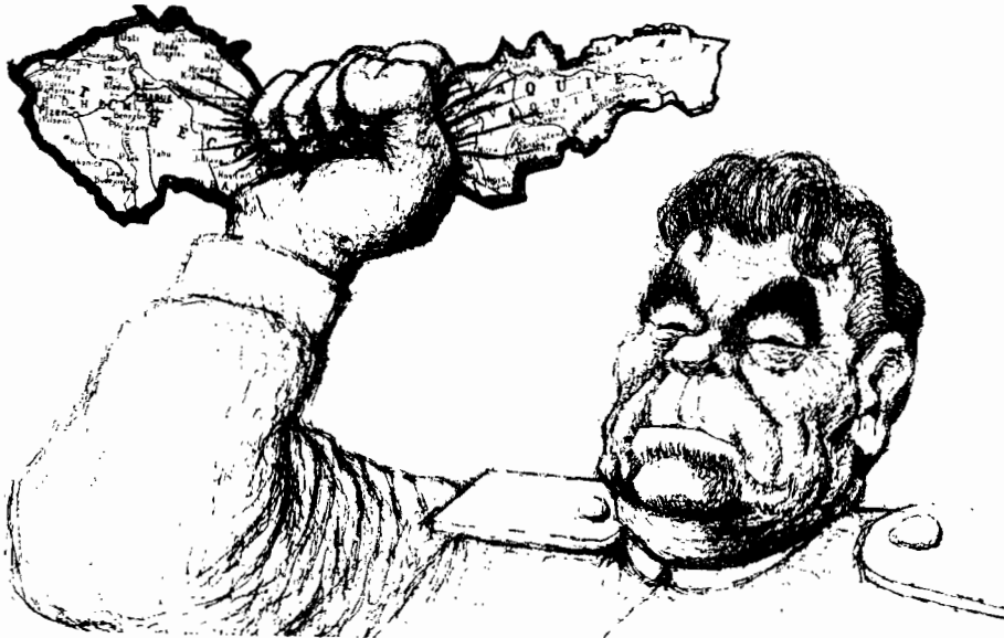
Cartoon by TIM, from the volume «Une certaine idée de la France » (Tchou - Paris)