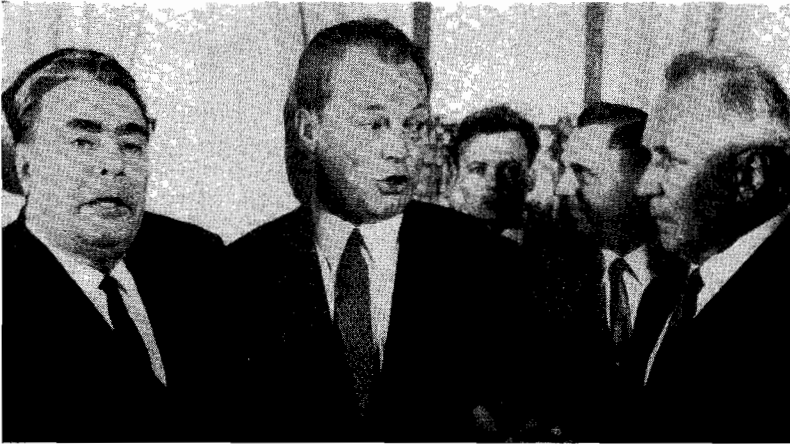
MM. Brejnev, Willy Brandt et Kossyghine

La politique extérieure de chaque puissance est soumise à un impératif géographique. Dépourvue de frontières naturelles, exposée à la double pression de l'Occident et de l'Orient, l'Allemagne suit, depuis deux siècles, un mouvement ondulatoire et, lorsqu'il semble que les buts d'une politique nationale ne peuvent être atteints avec l'appui de l'Occident, elle recherche l'entente avec l'Orient. Dans ce processus historique il y a cinq moments décisifs.