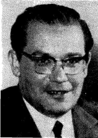
Franco Maria Malfatti (Italian)

Born at Rome in 1927, Sig. Malfatti was elected as a Christian-Democrat to the Chamber of Deputies in 1958, 1963 and 1968 for the constituency of Perugia. He was appointed Under-Secretary for Foreign Affairs in 1968, in August 1969 Minister for State Industries, and in March 1970 he became Minister for