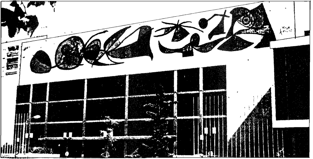
La peinture murale de Joan Miró sur la façade du Palais des Congrès et des Expositions de Madrid, siège de la Conférence sur la Sécurité et la Coopération en Europe.

Combien de temps résistera l'inviolabilité des frontières de l'Europe, proclamée au paragraphe III de l'Acte d'Helsinki, si l'Urss devait bloquer le golfe Persique ou l'entrée de la mer Rouge? Cent jours au maximum, c'est-à-dire le temps que dureront les réserves pétrolières de l'Europe; puis ce seront ces mêmes Etats souverains de l'Occident européen qui lèveront les barrières de leurs frontières pour permettre au pouvoir soviétique de les ravitailler en pétrole.