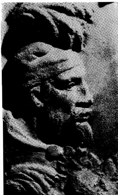
Decebal. Portret pe Columna Traiană.

30. DECEBAL , sfârșitul sec. I și începutul sec. II e.n. Marele erou al dacilor. În fața voinței lui Traian «optimus princeps» de a cuceri Dacia cu orice preț, Decebal luptă și pierde primul război dacic. Cum nu renunță la