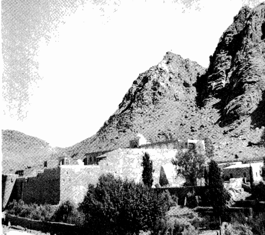
Vedere generală a Mănăstirii Sf. Ecaterina din Muntele Sinai.