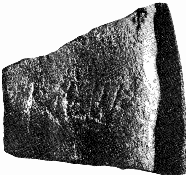
Buridava. Fragment ceramic cu inscripția REB, în litere latine.

Dar care ar putea fi semantica toponimului Buridavei și etnonimului Buridavensii? La Ptolemeu ( Geogr. III, 8, 4), coordonatele Buridavei apar greșite, undeva în Dacia nordică. Este posibil să fie și o confuzie de la tribul rășboinic la Burilor germani. Noi credem că semantica toponomasticeii buridavense trebuie îndreptată spre alte simboluri sacre, care au circulat în Dacia antică. Din Legenda Hiperboreenilor , la Diodor din Sicilia reiese, printre altele, noțiunea interesantă de Boreazi . Aceștia ar fi conducătorii regi-preoți, care conduc destinele «Hiperboreenilor», atât în centrul religios de la Sarmizegetusa, cât și în orașul Apulon din Dacia intracarpatică.