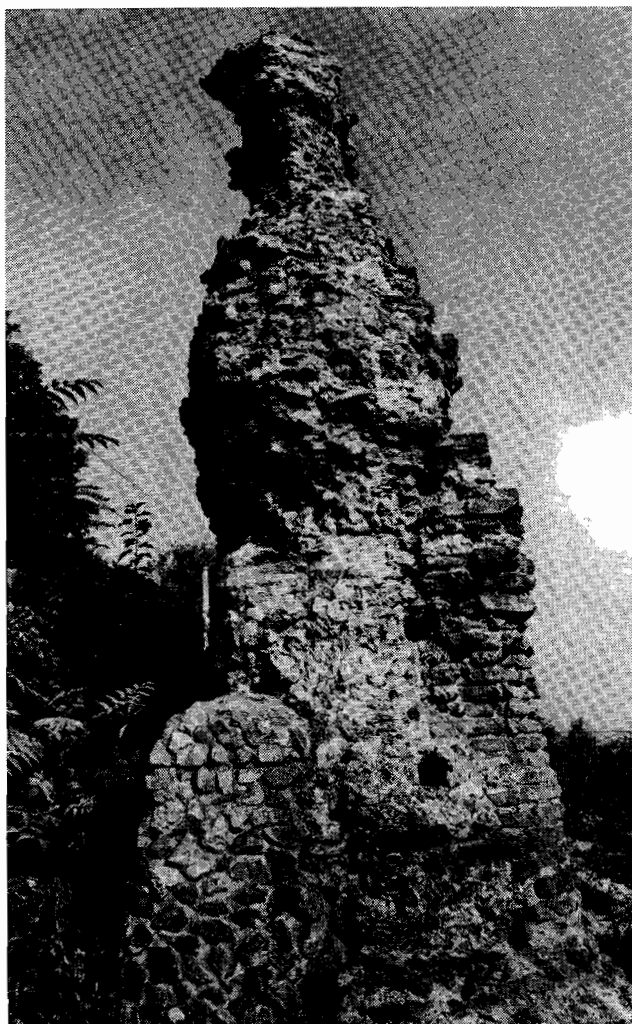
Ruine ale Podului lui Traian de la Drobeta

În ceea ce privește semantica hidronimului Danubius - Ister, este clar acum că denumirea de Danaris (Dunăre) , care singură a rămas din perioada daco-romană până azi, denumirea de Istru dispărând, ea ne semnifică pe Daci, Daoi, Dani, Davi ca locuitori majoritari de o parte și de alta a acestui fluviu, în partea sa mijlocie și inferioară.