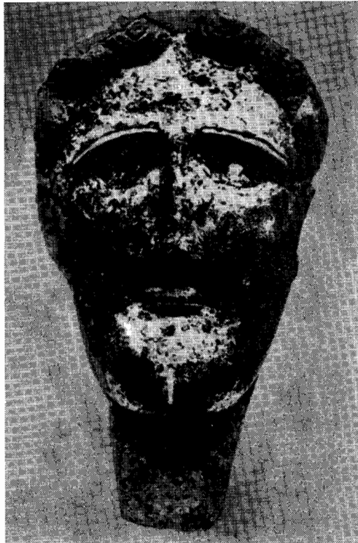
Buridava. Mască de bronz descoperită la Ocnița ce reprezintă, poate, o divinitate dacică.