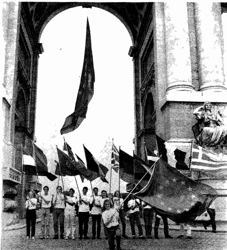
Un gruppo di giovani celebra a Bruxelles il XXX annuale della firma del Trattato di Roma che ha dato vita alla Comunità Europea.

Direttore degli affari economici della Nato (da Revue de l'Otan , agosto 1988)