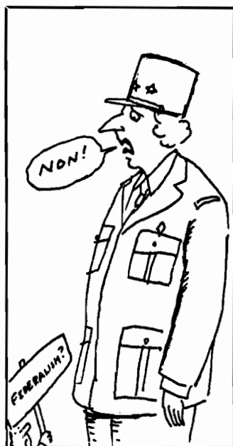
Margareth Thatcher negli abiti di De Gaulle.

Preoccupati i commenti di molti giornali in particolare per la sede qualificata dove il discorso antieuropeista della Thatcher era stato tenuto e cioè il Colle of Europe di Bruges. L'autorevole Economist sotto il titolo «Our Lady of Bruges» tenta di dare un colpo al cerchio e uno alla botte affermando che sarebbero ingiusti coloro che definissero antieuropea la filippica della Thatcher e aggiunge «l'Europa che la signora Thatcher vuole differisce significativamente dall'Europa di Delors. Non è un'Europa nella quale, come Delors pensa, la Comunità controllerà presto l'80 per cento della legislazione sociale ed economica, né un'Europa nella quale vi