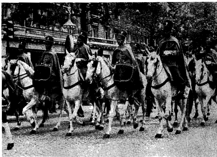
La Garde rouge de Dakar