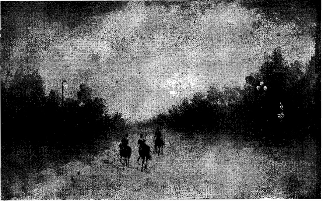
Nicola Grigorescu (1838-1907) - Paysage