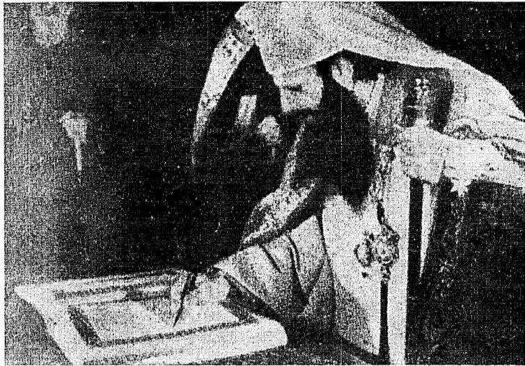
Patriarhul Justinian — trist instrument al poliției sovietice — semnând în Cartea sinodală actul trecerii clerului unit la Biserica Ortodoxă.

În școlile profesionale Episcopii nu mai numesc pe profesori, ei Statul,