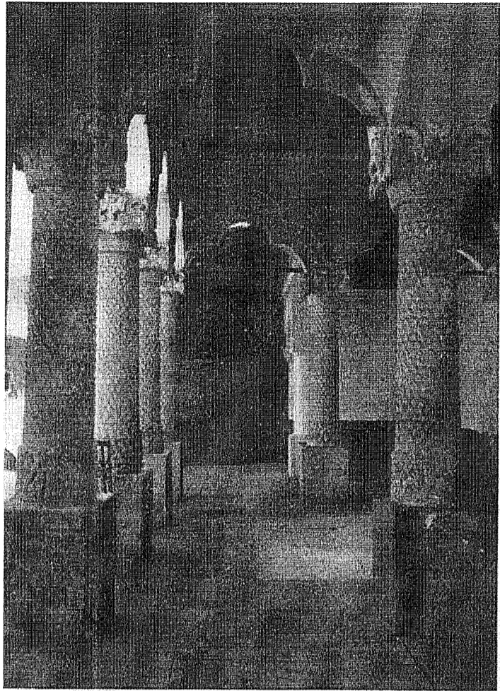
Manastirea Vacaresti (Bucarest)

Intaia ca si intalnirea celor doi stapani ai lumii apartine acum trecutului; aceluia trecut sbuciumat si mereu convalescent al unui prea lung «dupa rasboi»!