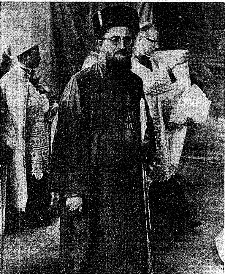
CONCILIUL ECUMENIC: Episcopi catolici de rit oriental

Cardinalul Bea, președintele Secretariatului pentru unirea creștinilor, a deplorat, în intervenția sa, faptul că schema «De Ecclesia» nu se sprână îndeajuns pe Sfânta Scriptură și recurge în schimb, prea des la tradiția recentă a Bisericii. «Ar fi fost mult mai oportun, ținând seama de scopurile ecumenice ale schemei — a spus cardinalul Bea — să se facă apel la patrimoniul tradiției antice, anterioară scisiunilor din veacurile XI și XVI, deoarece tradiția antică e comună întregii creștinătăți, din răsărit ca și din Occident. O definiție a Bisericii pe aceste baze comune ar putea fi mai ușor acceptată de frații despartiti».