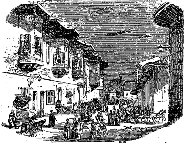
Bucurestii de alta data