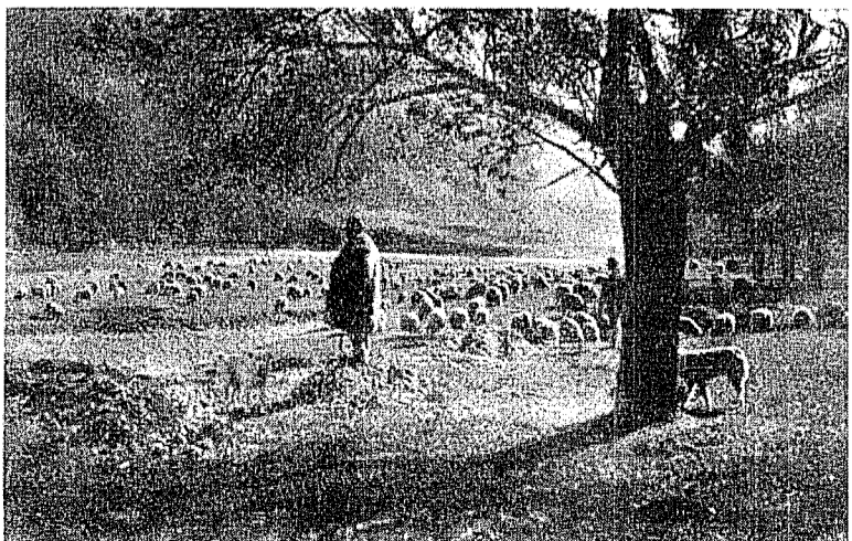
Turmă pe valea Oltului

Donațiile în bani se pot trimite la: DRESDNER BANK — Freiburg i. Brg. RUMANISCES KULTURHAUS Konto Nr. 18362. Donațiile în natură la Direcția Institutului: RUMANISCHE FORSCHUNGSINSTITUT — RUMANISCHE BIBLIOTHEK — 78 Freiburg i. Brg., Zastusstrasse 39.