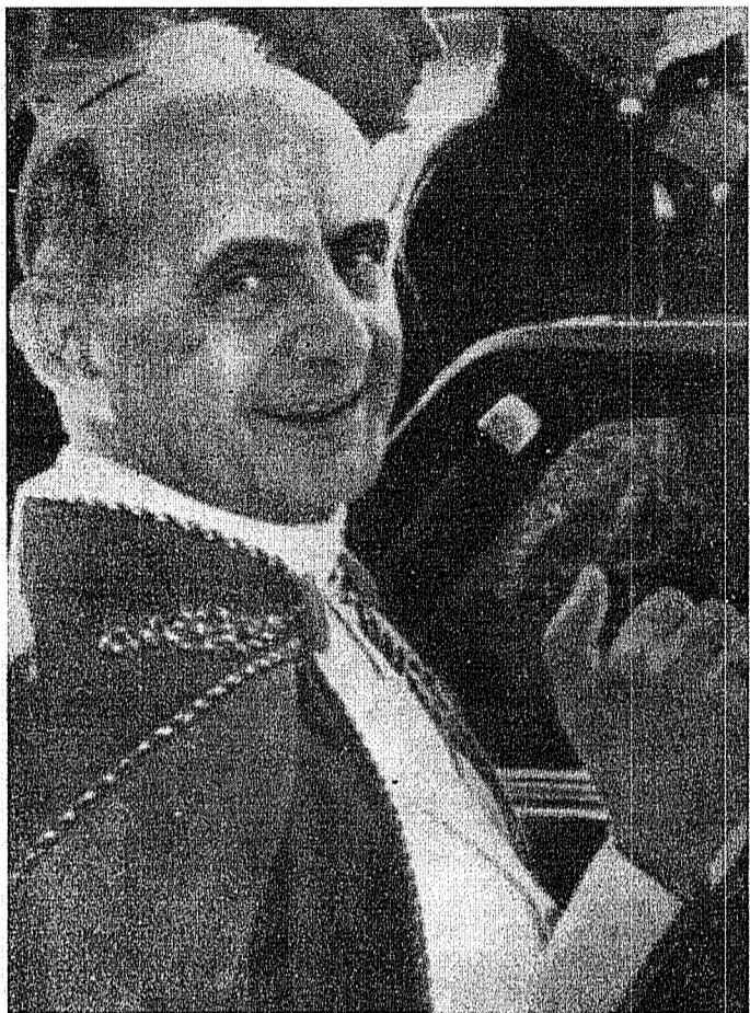
Sosirea la New-York a Sfântului Părinte

Milioane de persoane au salutat în Paul VI, pelerin al păcii pe meleagurile Americii, mesagerul unei mari speranțe: speranța că augustul, inspiratul său cuvânt ar putea inaugura o epocă nouă în raporturile dintre popoare, că ar putea deschide drumuri noi și mai puțin spinoase unui colocviu constructiv între națiuni, care să satisfacă exigența cea mai sinceră și mai profundă a fiecărui om de bun simț, oricărui crez, rase sau națiuni ar aparține: pacea.