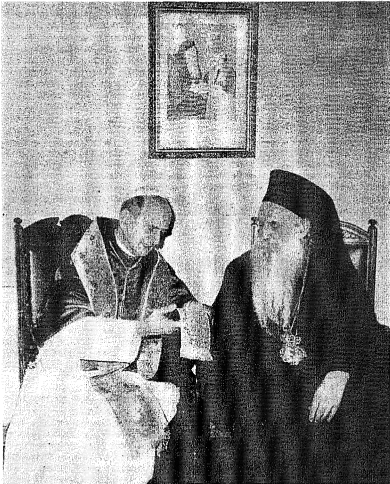
Papa Paul și Patriarhul Athenagoras

Destinat să fie o instituție permanentă, care să reprezinte întregul episcopat catolic, Sinodul era conceput ca un organism bisericesc central, al cărui scop era acela de a asigura o cooperare a episcopatului cu Papa, prin legături mai strânse și pentru binele Bisericii. In Bisericile răsăritene Sinodul e o formă ca să spunem așa normală de conducere, e un principiu bazilar, care își are originea în tradiția episcopatului și ră-