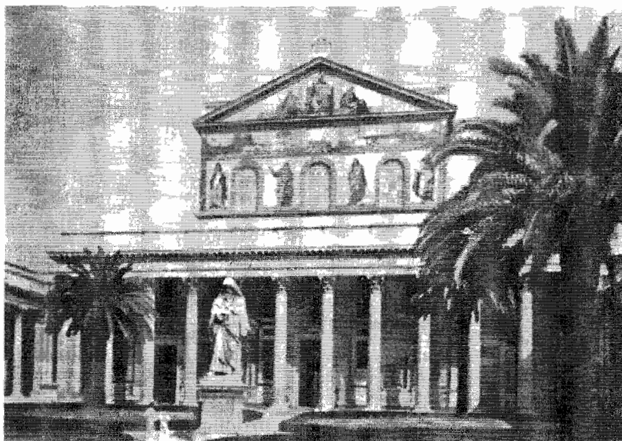
Roma: Bazilica St. Paul

Congresul și-a exprimat speranța ca energiile și eforturile ecumenice în prezent fracționate în grupări ecumenice naționale, să fie însumate și încanalate în organisme comunitare la nivel mondial.