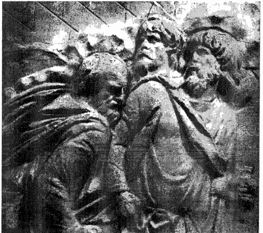
Roma: Coloana lui Traian: detaliu

Aceste aprecieri diplomatice nu sunt însă suficiente pentru a « îndulci » amarele și severele aprecieri ale cenzorilor.