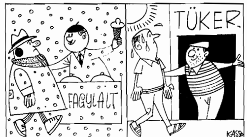
Hungarian market problems. (Tukör-Budapest).

Euratom's laboratories have advanced measuring and analysis equipment which can be used for nuclear and non-nuclear studies.