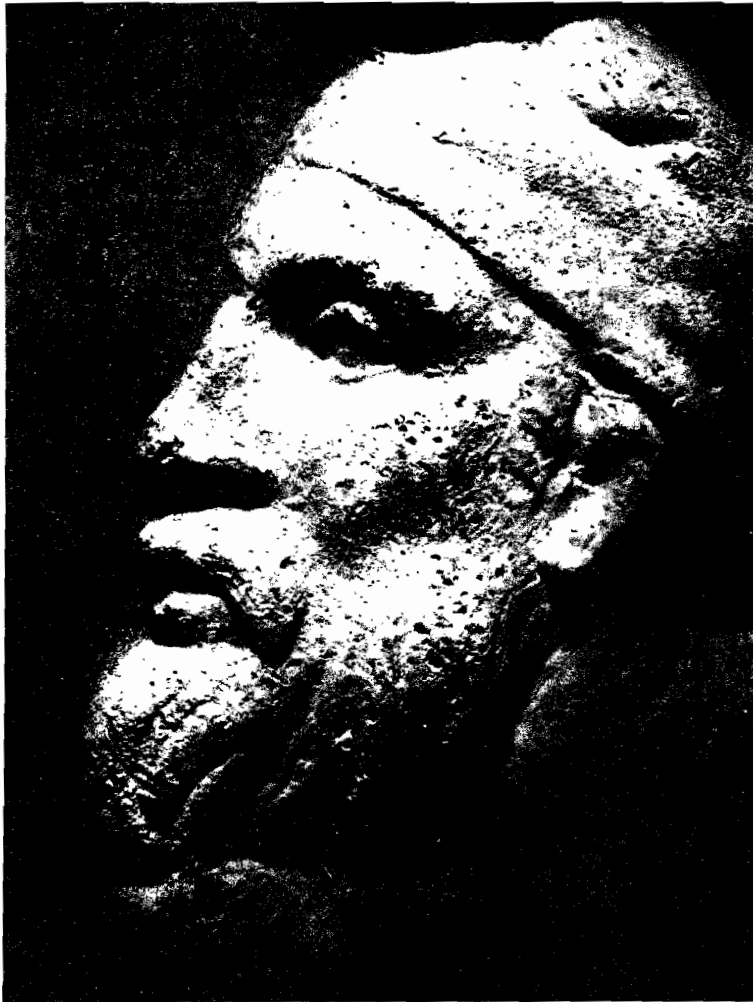
DECEBAL Basorelief de pe Columna lui Traian

gie juridică”, Editura Academiei, București, 1970 (pag. 29, 65-66 și 123).