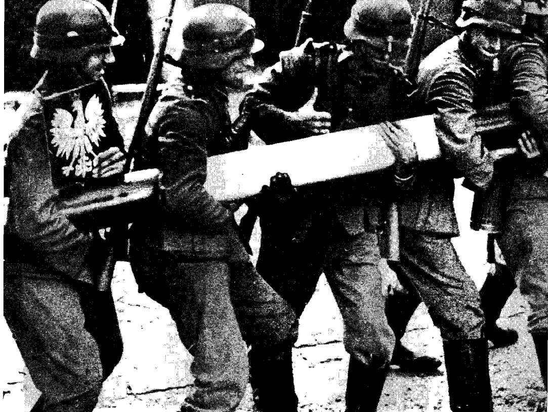
1 septembrie 1939. Soldați germani dau la o parte bariera de la frontiera poloneză

re încheierii pactului se răspândeau la fiecare ceas știri și zvonuri tot mai alarmante: ba că Hitler pretindea granițele din 1914, ba că în Polonia va fi impus un guvern nazist.