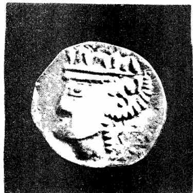
Fig. 4 Zeul dacilor Dion (Dionisos)