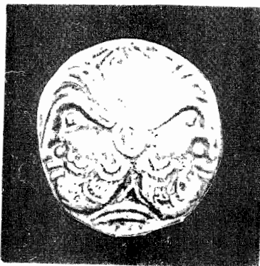
Fig. 3 Zeitateea politheos: Ianus-Cronos- Zalmoxis