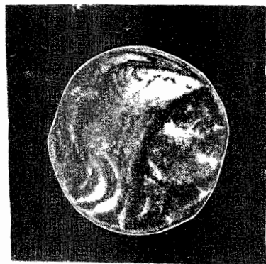
Fig. 6 Zeul dacilor Ari (Ares-Marte)