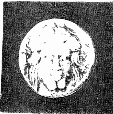
Fig. 1 Zeul dacilor Apulo (Apolo)