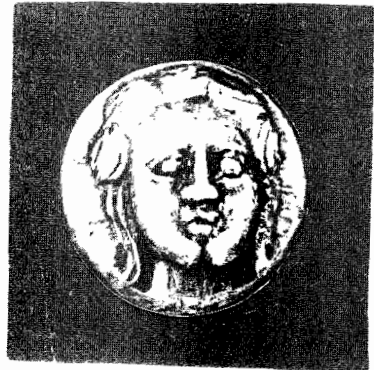
Fig. 2 Zeița dacilor Sarmis (Artemis)