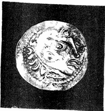
Fig. 5 Eroul dacilor Ira (Heracles)