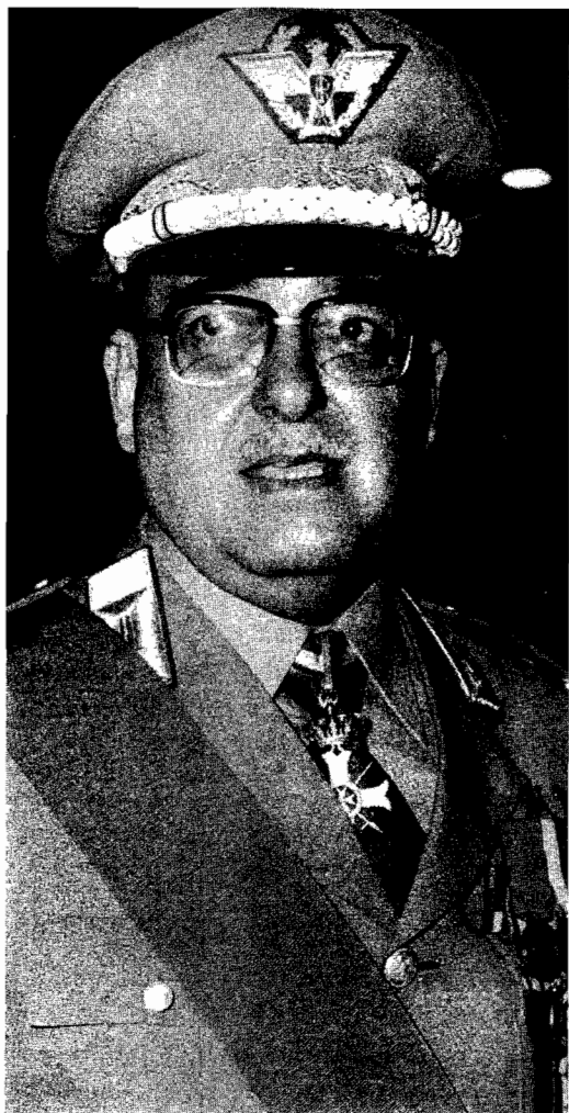
Le Général Carlo Alberto Dalla Chiesa

Telle est la signification de la corde au cou que les auteurs de «Les Oubliés de Palerme» ont nouée autour de la conscience des citoyens siciliennes: un message avec lequel nous sommes, nous aussi, pleinement d'accord.