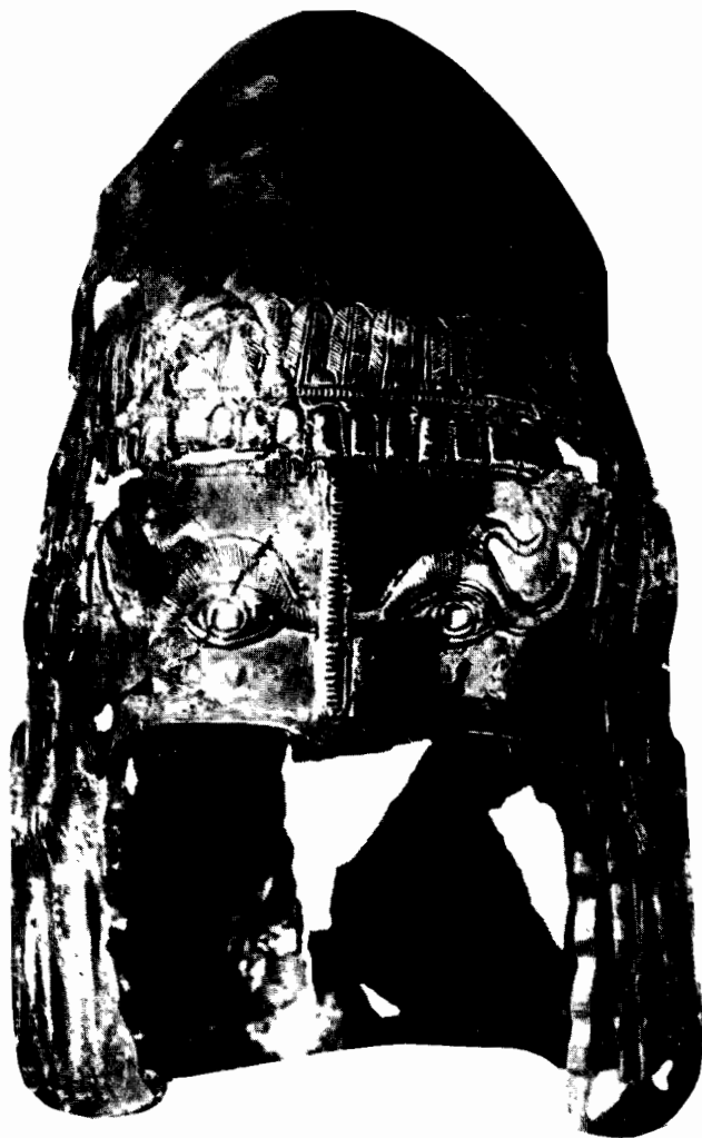
Cască de stil scitic, de argint, cu părți aurite, provenind din mormântul trac din sec. V-IV î.e.n.

S-a susținut, și se merge pe aceeași linie, că Dacii n-au lăsat opere scrise,