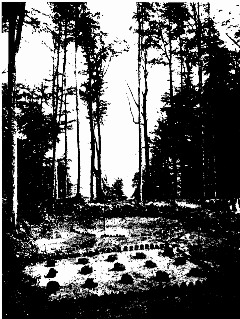
Urme ale sanctuarului dac de la Sarmizegetusa

Cine erau acești «Romani» din Dacia? marele istoric francez Camille Jullien spune: «Se repetă neconținut numele de roman și de limbă latină și n-a fost niciodată în istoria lumii un amestec de oameni mai deosebiți de fire și mai depărtați de originea arătată prin numele lor și prin idiomul lor decât acei care purtau numele Romei și-i vorbeau limba» (Din N. Iorga, Istoria Românilor , I, p. 192). E cea mai clară și concretă oglindire a Romanilor. Nu se știe în ce măsură vorbeau limba romană și cât o foloseau. Așadar, acești Romani au fost înzestrați cu puteri miraculoase să «romanizeze» pe Daci, cei