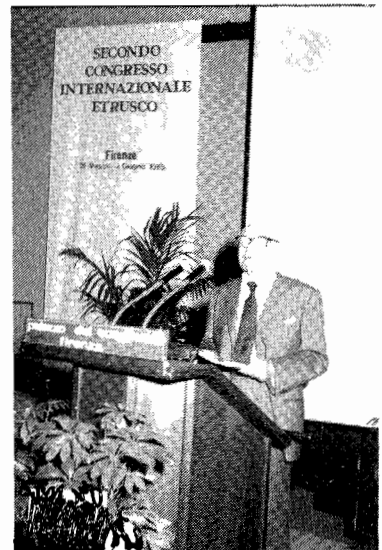
Au Congrès d'Etruscologie de Florence.