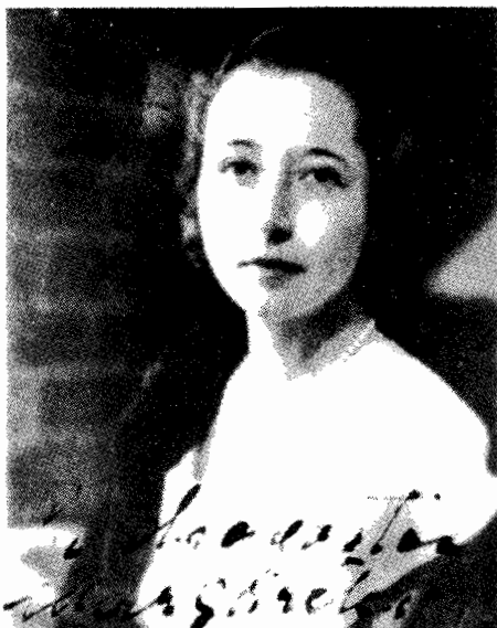
Maria Antonescu, soția Mareșalului Ion Antonescu

În timpul bombardamentului de la 4 aprilie, când întreaga Călea Griviței a fost distrusă, Consiliul de Patronaj a organizat, cu ajutorul armatei, echipe de bucatării ambulante, care să ducă de mâncare sinistraților care nu vroiau să-și părăsească locuințele distruse. Mâncarea era adusă de la restaurantele Consiliului.