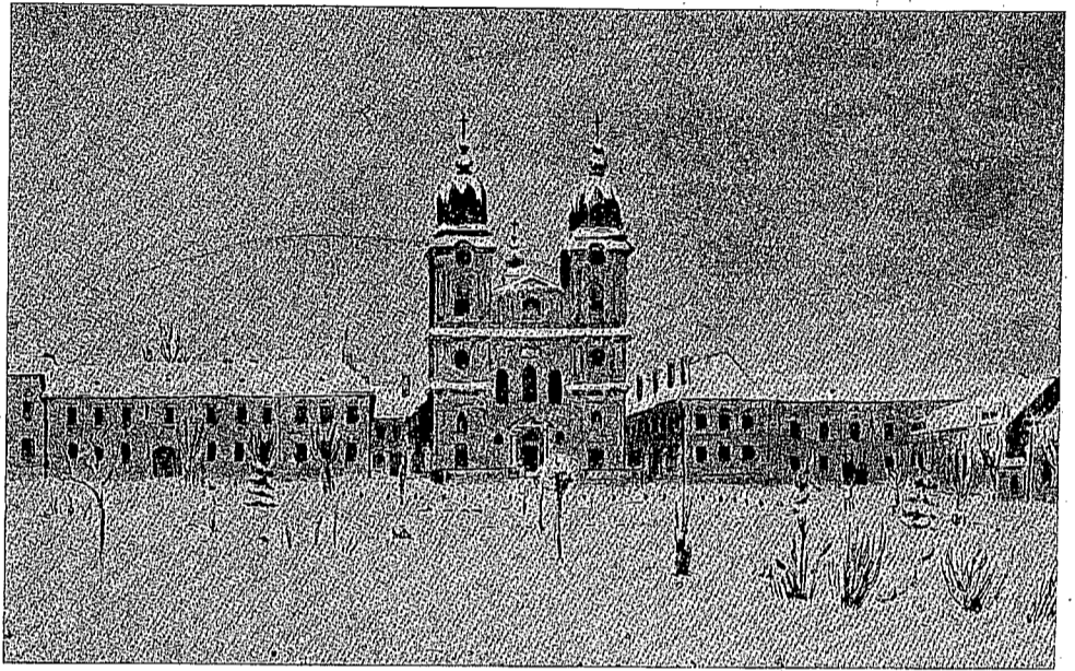
Mitropolia Unită din Blaj

Nouă ani au trecut de la obrobrioasa lichidare a unei Bisericii vinovată de a fi apărât legile lui Dumnezeu împotriva legilor slugilor Cremlinului. Nouă ani de lacrimi și de durere, care nu se vor șterge niciodată din istoria Bisericii. Comuniștii cred că instituțiile spirituale se pot inventa sau lichida ca prăvăliile sau cinematografele. Ei își fac iluzia că numele martirilor bisericeii suprimate s'au șters din memoria noastră, așa cum se întâmplă acasă la ei cu cei care sunt despoiați de putere și aruncați la gunoi, atunci când se vrea să se instaleze pe soclul adulației un nou idol. Credeți ce vor! În ce ne privește noi credem în eternitatea și în dreptatea lui Dumnezeu; credem în invierea sângelui care a fost vărsat pentru cauza lui Dumnezeu și pentru gloria Lui, mai înaltă și mai durabilă decât o sută de Sputnik lansaj în cerul saturat de gemete ale pământurilor pe care ei le-au cutropit și le-au robit. Sângele martirilor Bisericii va cădea asupra lor, așa cum va cădea tot ceace-și au comis în numele materiei.