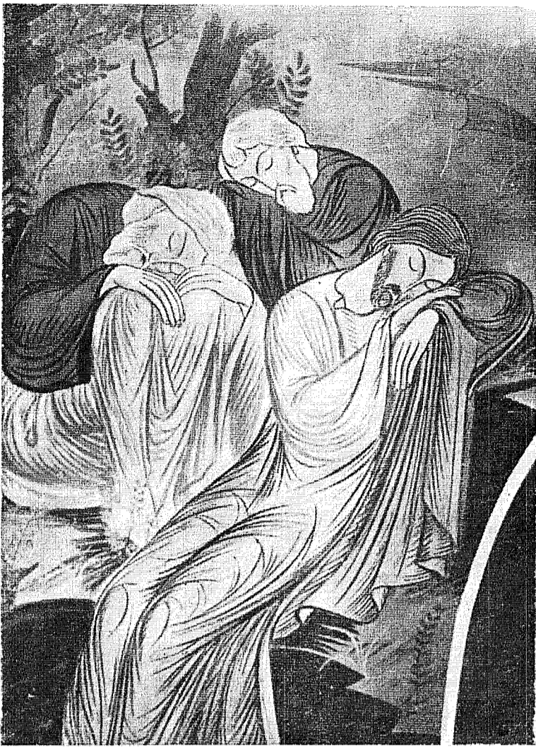
Splendidă frescă modernă în biserica de la Rășboieni Noni (Iasi)