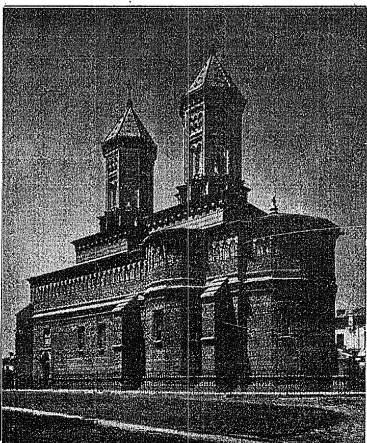
Biserica Trei Ierarhi (Iași)