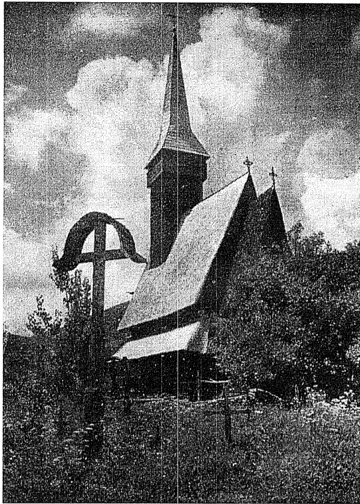
Biserică de lemn în Ardeal

Din enorma cantitate de probleme discutate de Conciliu în ultimul timp, am ales, pentru a le prezenta cititorilor noștri, câteva capitole ale schemei a treisprezecea, «Biserica și lumea modernă», care tratează probleme de interes universal și de o mare și uneori dramatică actualitate.