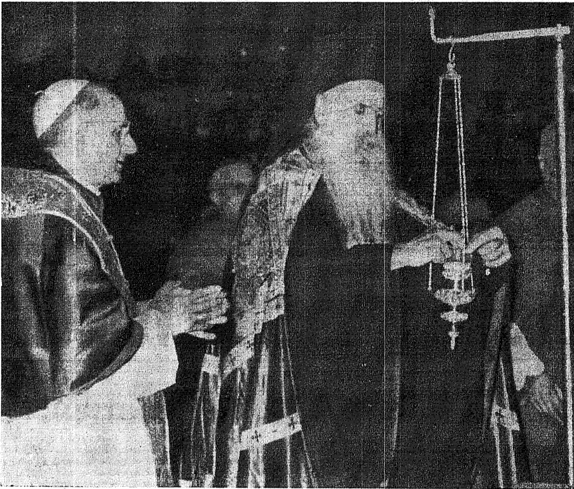
Patriarhul ecumenic Athenagoras aprinde în «Confesionalul» din Basilica Sfântului Petru pretioasa «candelă» pe care a donat-o Mormântului Sf. Petru.

Un adevărat delir de aplauze și de ovatii, ritmat de dangătul solemn al clopotelor Bazilicii vaticane sunate «în dublu», ca la Paști, au salutat intrarea Sanctității Sale Patriarhul Athenagoras I în atrium-ul Templului Crestinătății, unde, transfigurat de emoție, îl aștepta Papa.