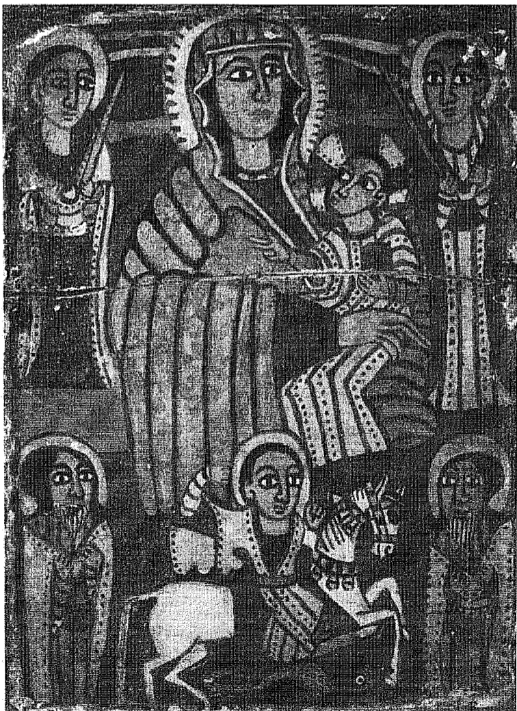
Artă populară abisiniană din secolul XVII-lea.