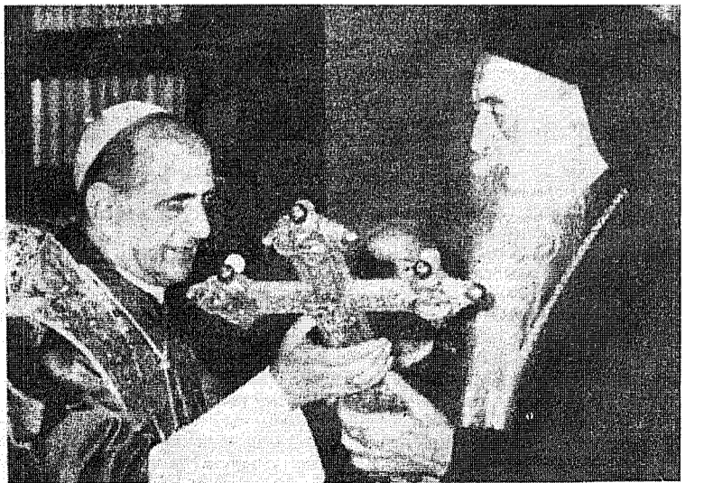
Papa Paul al VI-lea dăruiește Patriarhului Athenagoras un crucifix antic de argint la sfârșitul întâlnirii din Biblioteca Vaticanului.