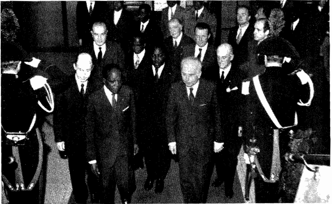
Le Président L. Senghor (à gauche) durant une de ses récentes visites officielles en Italie. A droite, le Ministre italien M. Ripamonti.