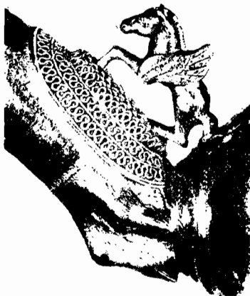
Detaliu după o diademă de aur găsită la VIX, Franța, care prezintă analogii cu arta traco-getă.