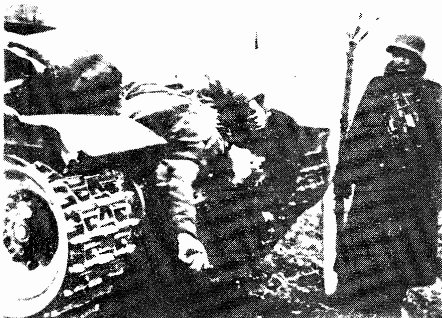
Cadavrul unui român ucis la 9 sept. 1940 la Tresnea, jud. Sălaj, de soldați ai armatei hortyste