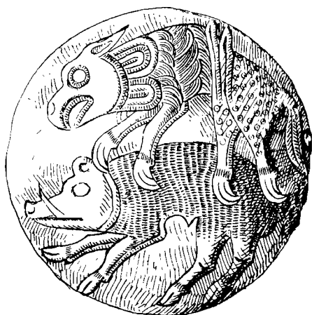
Agighiol. Decor pe un vas.

cerea la o agricultură propriu-zisă, a fost o unealtă tipică pentru lumea geto-dacică, folosită și mai târziu de-a lungul perioadei daco-romane și apoi mult după aceea. Ceramica geto-dacică, lucrată cu roata, sau în tehnica tradițională cu mâna, are un izbitor caracter unitar, repertoriul său de forme pornind în principal de la forme străvechi tracice, cât și de la unele prototipuri elenistico-romane.