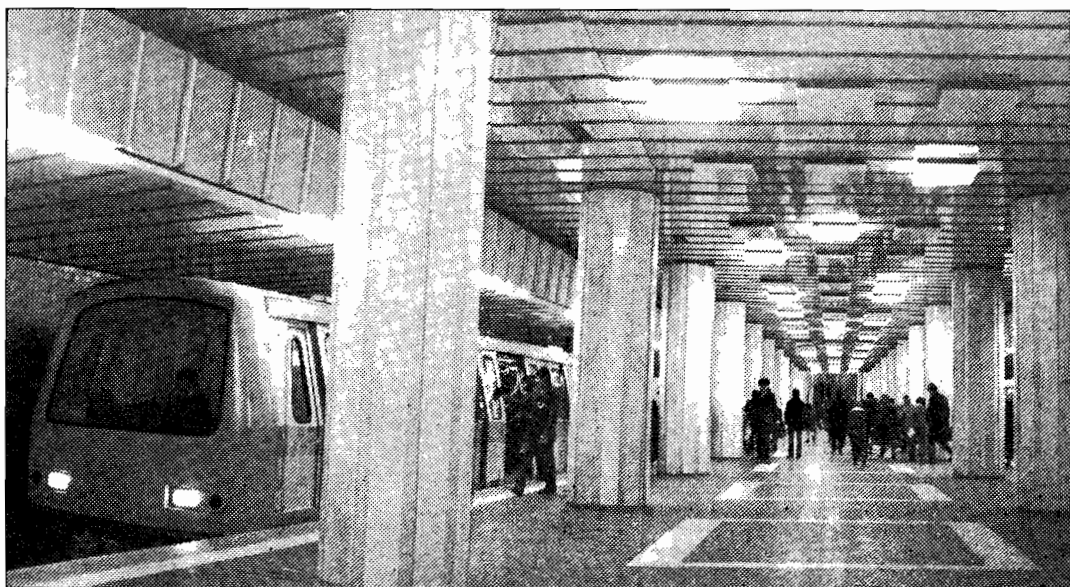
Stație de metrou la București

În ziua de 29 mai 1982, un mare număr de Români din Franța, Elveția, Germania de Vest și Belgia s-au întâlnit la cimitirul din Soutzmatt și au oficiat parastas pentru Eroii Neamului ce dorm acolo somnul cel de veci.