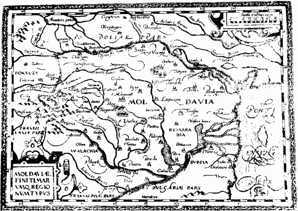
Harta lui Reichersdorf (1541).

În izvoarele rusești, numele cetății figurează la plural Soroki . Însă în harta lui Reicherdorf din secolul al XVI-lea, găsim acest nume la singular Sroca , cu terminația -ca , adică Soroca și tot așa figurează această denumire și în izvoarele istorice românești.