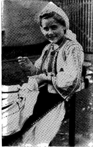
Fată tânără din Rășinari.

Aceeași idee și atitudine estetică își găsește o formulare corespunzătoare la Octavian Goga tot într-un din Fărămituri , cum își numea propriile reflecții: «Poetul care a început să plângă cu mulțimea a pierdut dreptul la propriile lacrimi» ( Pagini noi , Ed. Tineretului, p. 70).