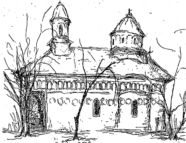
Veche biserică moldovenească

Primul act — al abdicării — al doilea act — al creării Republicii —