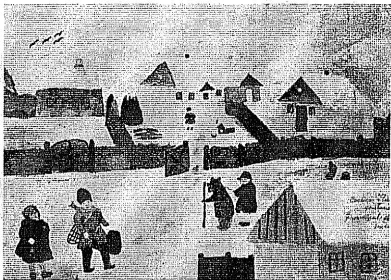
Desene de copii români (1939)

Nu s'au gândit de sigur inovatorii de la București că botezându-l pe