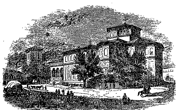
Bucureștii de altă dată