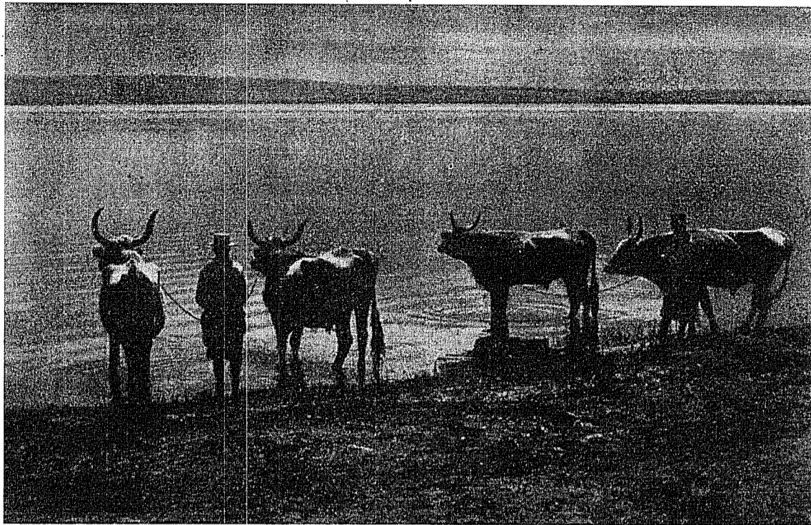
Amurg pe Dunăre

Este regretabil că nici de data aceasta Ortodoxii nu au putut prezenta un punct de vedere comun, dar socotim înțeleaptă decizia de a da libertate fiecărei Biserici Ortodoxe naționale să procedeze cum vrea și cum îi dictează interesele.