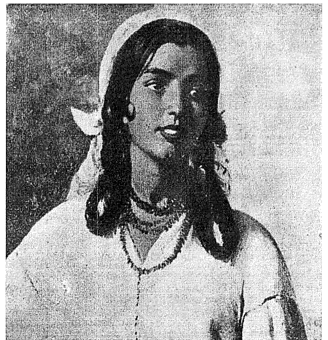
Teodor Aman - Tărăncuță

Cincisprezece personalități catolice vor fi invitate ca «observatori delegați» la această a treia întrunire a Consiliului; aceasta înseamnă că pentru prima oară catolicii vor putea lua cuvântul în ședințele publice.