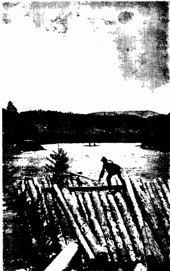
Plută pe Bistrița

Ce se ascunde sub această iritabilitate nu e ușor de ghicit: conștiința vinovată de a fi comis o crimă enormă potrivit intereselor românești, sau vre-un alt motiv care nu poate fi mărturisit?».