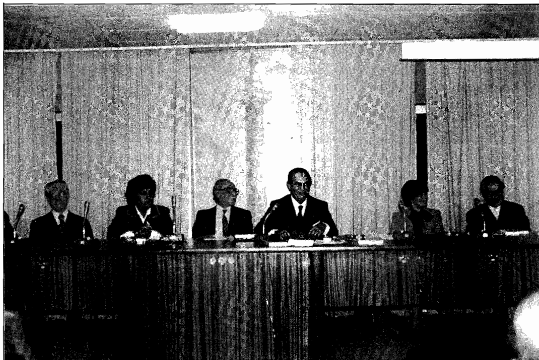
Imagine din timpul lucrărilor. Vorbește Prof Iosif Constantin Drăgan

În cadrul preocupărilor actuale de unificare a Europei, studiile de tracologie făcute în acest sens se dovedesc a fi foarte actuale.