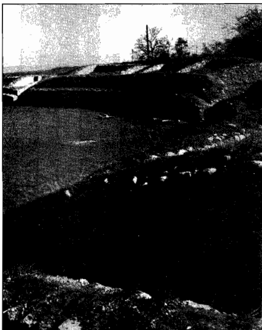
Ulpia Traiană Sarmizegetusa

și Dacia. În Muntenia și sudul Moldovei se poate vorbi chiar de o antrenare hotărâtă a populației autohtone pe făgașul romanizării. După desființarea provinciei Dacia, când nu mai existau granițe bine păzite de numeroase trupe romane, și nici bariere vamale, aceste legături s-au intensificat, ceea ce a contribuit la romanizarea regiunilor respective. Tocmai astfel se poate explica dispariția, prin secolele IV - V, a Dacilor liberi din câmpul documentării arheologico - istorice.