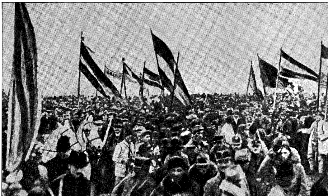
Marea Adunare de la Alba Iulia din 1 decembrie 1918

Tot sfârșitul secolului al XIX-lea este marcat de o opoziție constantă și crescândă a intelectualității transilvănene împotriva grelei dominații unghurești. Oamenii politici transilvăneni sunt eroi ai acestei rezistențe. Au loc numeroase procese ca cel al Memorandum-ului din 1894. 25 de Români au fost arestați, judecați pentru înaltă trădare la Cluj de un tribunal maghiar și condamnați foarte aspru pentru că îndrăzneau să ducă doleanțele lor în fața împăratului. Împotriva acestui proces și a condamnărilor, Francezii au protestat. Ernest Lavissee trimitea condamnaților o telegramă de încurajare. Istoricul francez Alfred Rambaud scria lui V.A.Ureche că deținuții au ridicat o problemă ce va trebui să-și găsească soluționarea.