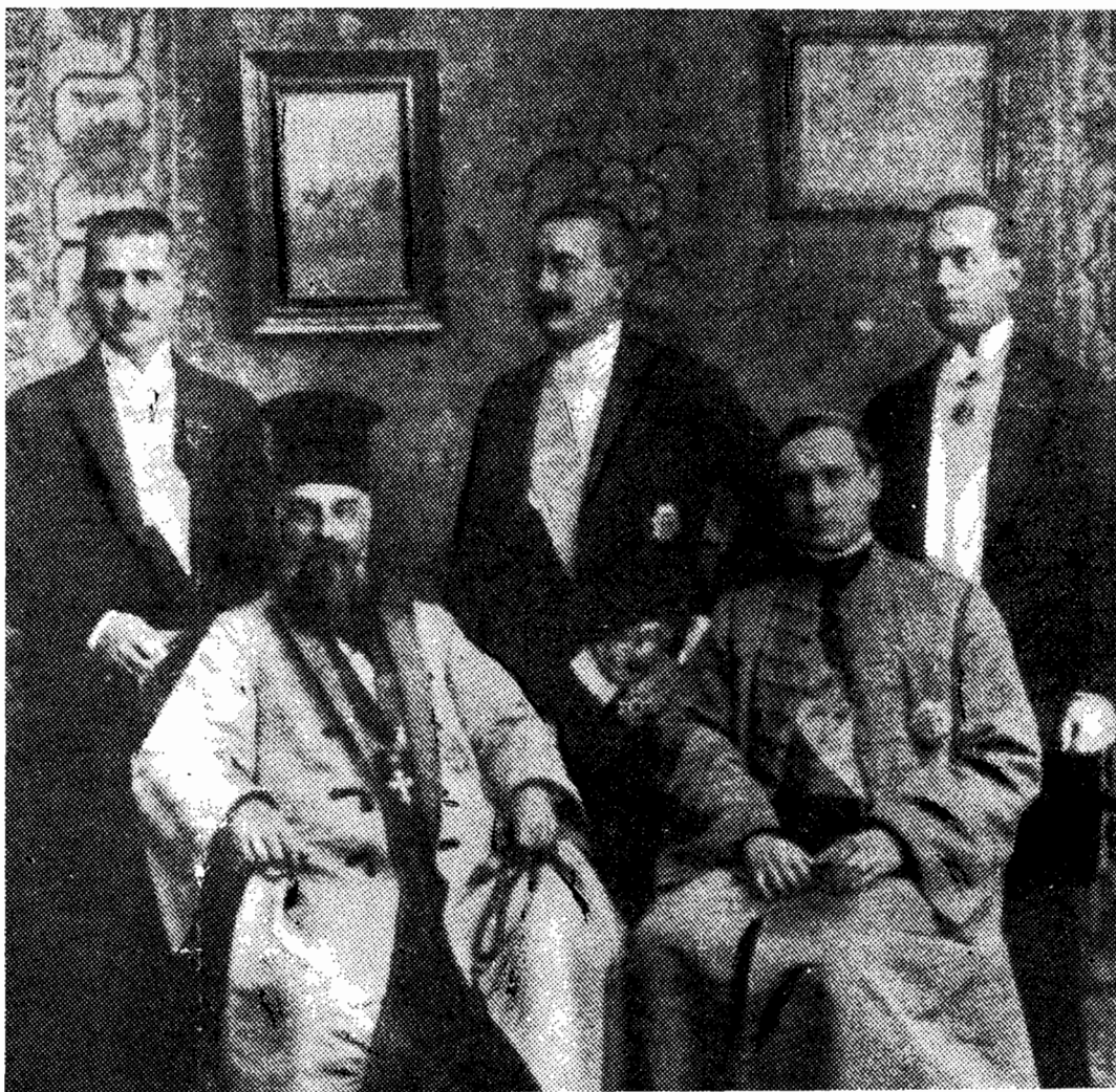
Delegația care a dus actul Unirii la București: Vasile Goldiș, Alexandru Vaida Voievod, Caius Brediceanu, Miron Cristea și Iuliu Hossu.