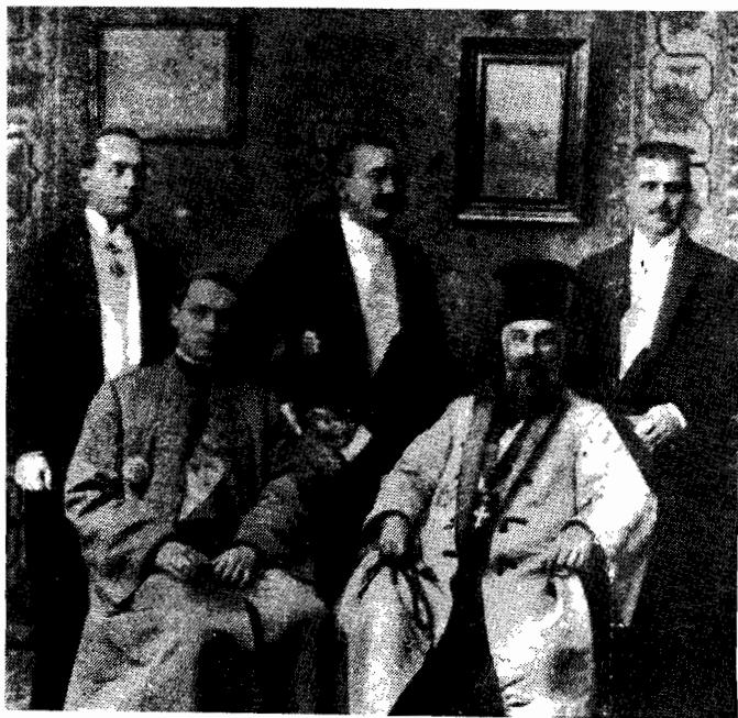
Delegația care a dus actul Unirii la București

pentru a face școli și spitale, biserici, institute de știință și arte și a înzestra și organiza nebiruit falnica noastră armată română. Nu trebuie să lăsăm epuizate țintele noastre naționale pentru realizarea unității noastre de stat. Vai de neamurile care nu știu să-și propună în continuu noi și noi ținte de atins, noi și noi idealuri de realizat. Să sprijinim și să ocrotim pe frații noștri rămași peste hoatre, care odată și odată ne vor prinde bine acolo unde sunt. Să cultivăm și să înfăptuim înalte idealuri ale civilizației omâne, să realizăm marea idee de pace a omenirii și, în acest scop, să încheiem legături strânse între toate națiunile și statele care ne înconjură, indiferent de ceea ce ne-a putuț despărți odată. Să lucrăm din toate puterile pentru înfrățirea popoarelor acestei părți din lume, la munca comună pentru ideea păcii și a propășirii umane.