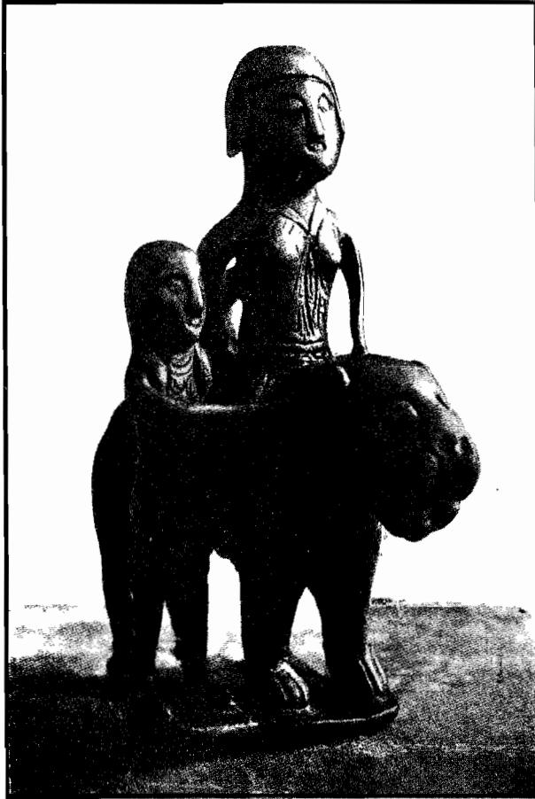
Cybela cu Attis, găsită la Năeni, jud. Buzău.

În comuna Năeni, la 30 de km sud, s-a găsit o statueta de metal ce prezintă pe Anaitis (zeiță corespondent lui Cybela la Sciți).