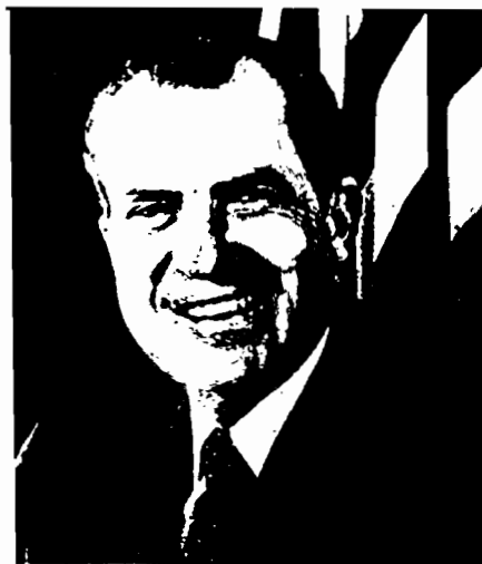
Richard M. Nixon.

Țin să precizez, fără cel mai mic echivoc, că, personal, consider că Richard Nixon este unul din cei mai valoroși oameni de stat ai Statelor Unite, care, cu siguranță, va rămâne unul din marii președinți ai Americii, în isto-