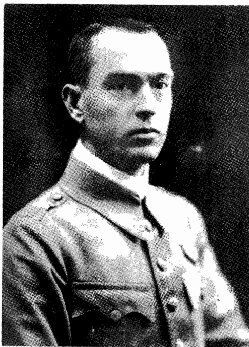
Colonelul Ion Antonescu, Comandant al Școlii Speciale de Cavalerie - Sibiu, 1920-1922