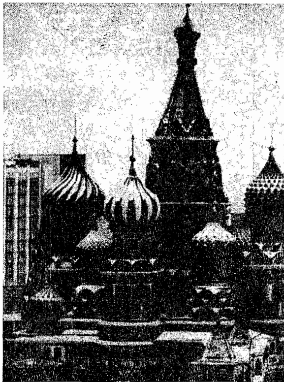
La cattedrale di San Basilio sulla piazza Rossa.

E ad oltre mille anni dalla cristianizzazione della Russia, e nel momento in cui l'Unione Sovietica scompare non è fuori