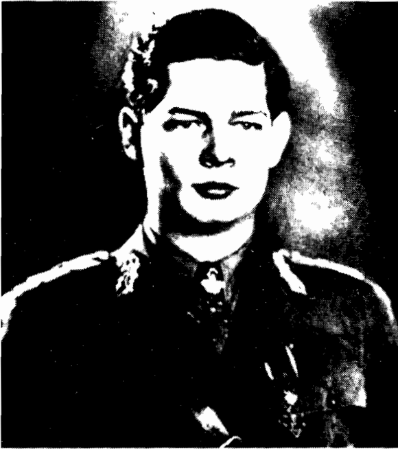
Regele Mihai I