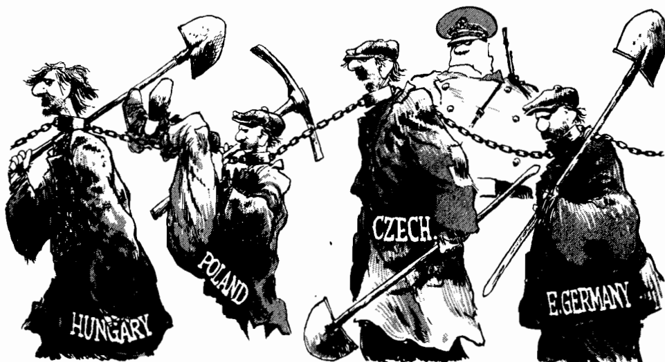
Polonia și Imperiul Rusec.

În Sunday Telegraph din 26 oct., Peregrine Worsthorne scria, cu drept cuvânt: "Ce vrea Apusul să vadă că se întâmplă în Polonia, care este astăzi un teren plin de nesiguranță pentru Uniunea Sovietică? După eșuarea răscoalelor de la Budapesta și Praga, Apusul a ajutat imperiul sovietic, descurajând orice discuții de liberalizare. Sateliții ei au fost și sateliți trebuie să rămână, victime neputincioase pe altarul "destinderii". Aceasta fiind situația, Apusul a acceptat hegemonia sovietică, fără alte chestiuni, ca o necesitate a păcii mondiale. Dar după evenimentele din Polonia e clar că aceasta nu vrea să mai accepte statu-quo. Același lucru, în întreg Estul Europei".