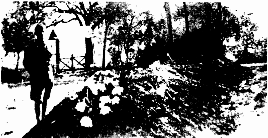
Soldat honvez păzește mormântul de la Ip, pentru ca Românii să nu pună flori la martirii lor

Inspiratul scriitor constata că «Ardealul, pe care l-a îmbrățișat cu iubire de mamă țara celor șapte fântâni de aur, se întreba cu glasul ciocârliei: poate iar să se întunece cerul de blesteme? să îngenuncheze desnădăjduit moșneagul care și-a pierdut toate odoarele, și în poarta bisericuțelor de lemn să bată braț de dușman, ca să cadă icoanele strămoșești de pe pereți, să se frângă prapurii pe care i-a purtat rugăciunea credinței și altarul să-l năruie fame-nii?»